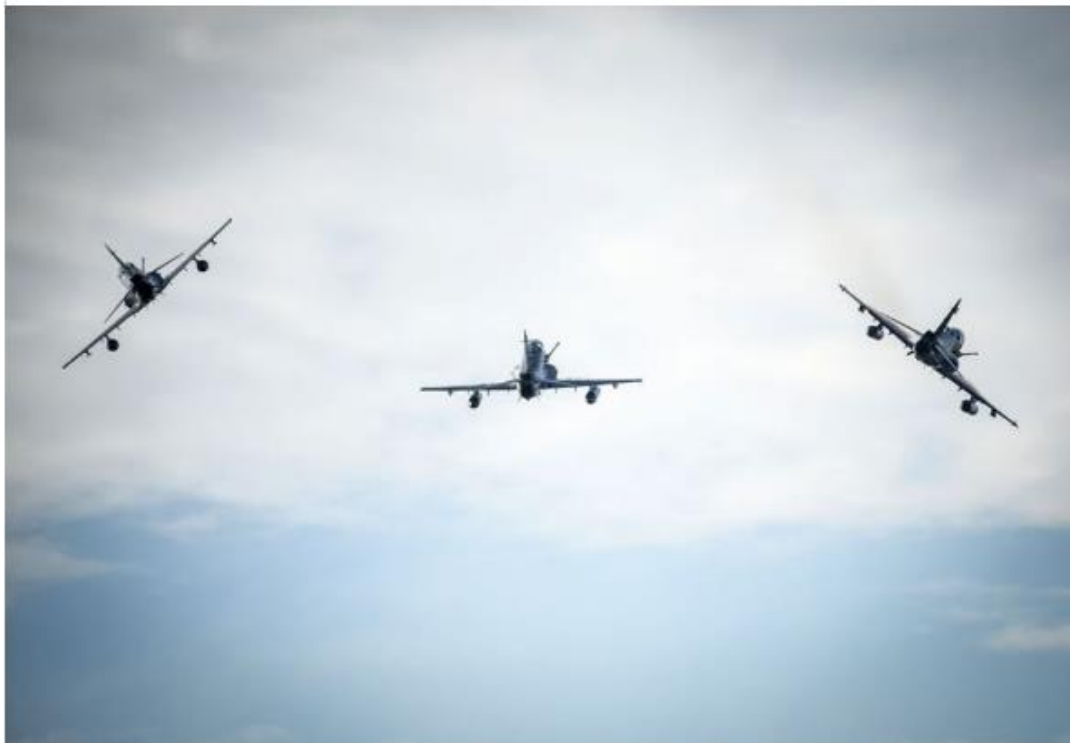
大马政府今日在在2019年浮罗交怡国际海事与航空展（LIMA）上与各公司签署价值40亿令吉的采购和工业合作计划合约以及谅解备忘录。

大马政府今日在在2019年浮罗交怡国际海事与航空展（LIMA）上与各公司签署价值40亿令吉的采购和工业合作计划合约以及谅解备忘录。