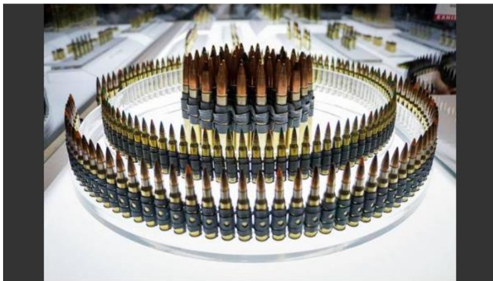
Pameran DSA dan NATSEC Asia 2024 edisi ke-18 dijadual berlangsung di MITEC. - Foto fail

KUALA LUMPUR: Pameran Perkhidmatan Pertahanan Asia (DSA) dan Pameran Keselamatan Kebangsaan (NATSEC) Asia 2024 dari 6 hingga 9 Mei depan bakal menerima penyertaan lebih 1,200 syarikat daripada 45 negara, terbesar dalam sejarah penganjurannya sejak 36 tahun lepas.