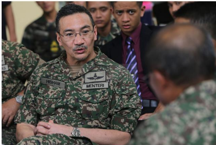
Menteri Pertahanan Datuk Seri Hishammuddin Hussein berkata Malaysia sedia menggunakan pendekatan Arab Saudi bagi mengenal pasti ideologi propaganda Isis dan peranan media sosial dalam merekrut ahli kumpulannya. – Gambar fail The Malaysian Insider, 18 Februari, 2016.

Malaysia bersetuju menggunakan 3 pendekatan Arab Saudi dalam memerangi Daesh atau militan Negara Islam Iraq dan Syria (Isis) termasuk mengenal pasti sumber kewangan kumpulan penganas itu, kata Menteri Pertahanan Datuk Seri Hishammuddin Hussein.